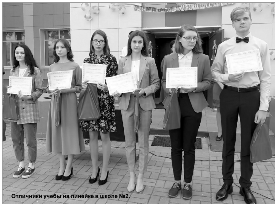
Отличники учебы на линейке в школе №2.

Начальная школа - фундаментальный, пожалуй, самый важный этап образования, и от того, как ребята учатся в первые четыре года, во многом зависят их будущее, успешность и вся дальнейшая жизнь. Не так-то просто завершить обучение в начальной школе на одни пятерки! Но ребятам это удается. И отрадно, что таких ребят с каждым годом становится все больше - в этом году начальную