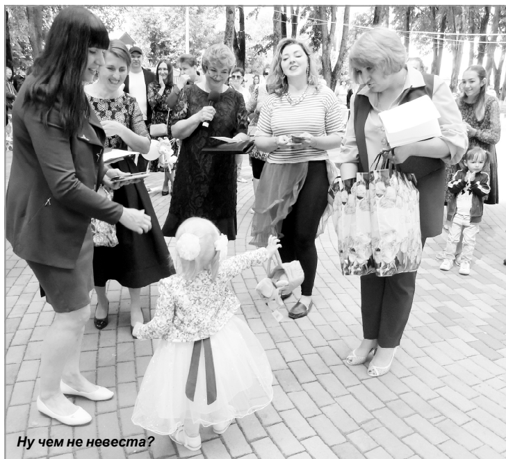
Ну чем не невеста?

Отделом записи актов гражданского состояния администрации МР «Спас-Деменский район» произведена регистрация смертей 133 граждан.