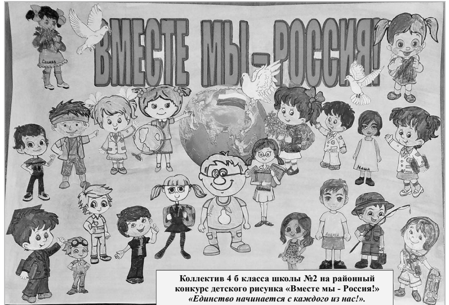
Коллектив 4 б класса школы №2 на районный конкурс детского рисунка «Вместе мы - Россия!» «Единство начинается с каждого из нас!»