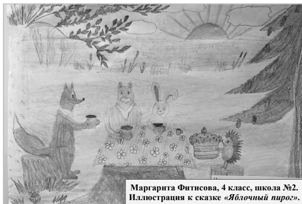
Маргарита Фитисова, 4 класс, школа №2. Иллюстрация к сказке «Яблочный пирог».