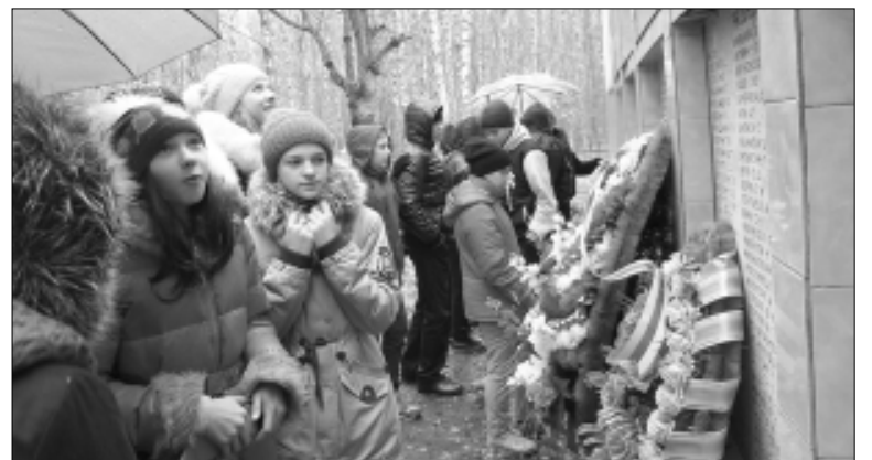
Страницу подготовила Антонина БЕСОВА.