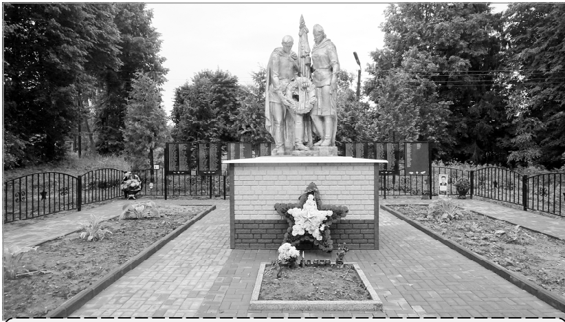
Так стало выглядеть братское захоронение после реконструкции.

жащем состоянии, проводился косметический ремонт, вписывались новые фамилии. Однако деревья и декоративные кустарники выросли, заслонили собой памятник, металлическое ограждение стало старое. Одним словом, братское захоронение и прилегающая к нему территория нуждались в серьезном обновлении. Работники