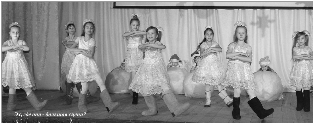
Эх, где она - большая сцена?

- Ограничения, которые возникли сейчас в работе, открывают новые возможности для занятий танцами благодаря современным способам видеосвязи.