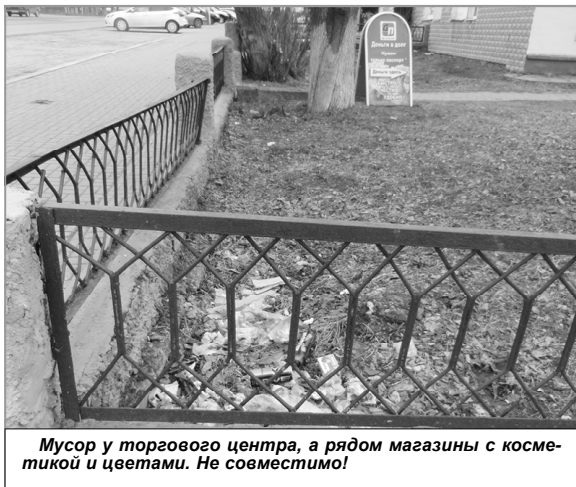
Мусор у торгового центра, а рядом магазины с косметикой и цветами. Не совместимо!