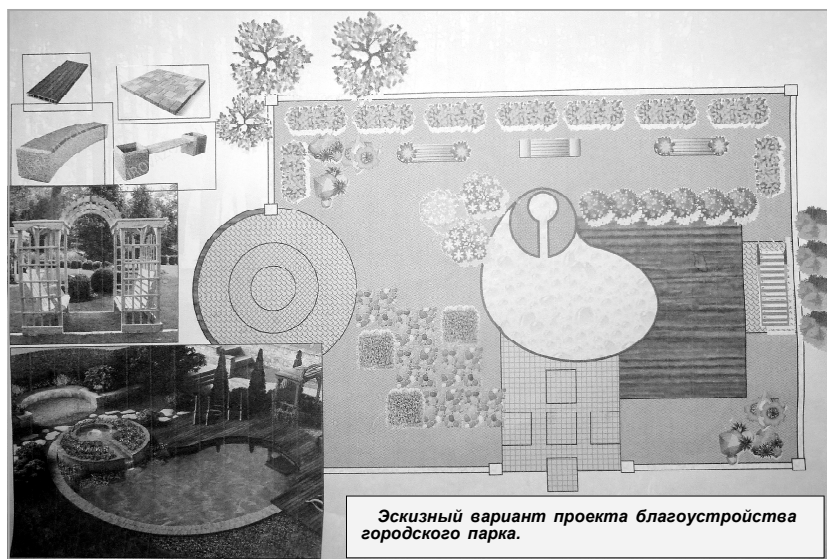
Эскизный вариант проекта благоустройства городского парка.