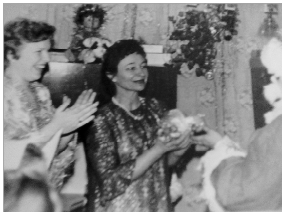
Новогодний утренник в детском саду, декабрь 1984 года.

С. ЦВЕТКОВА, библиотекарь.