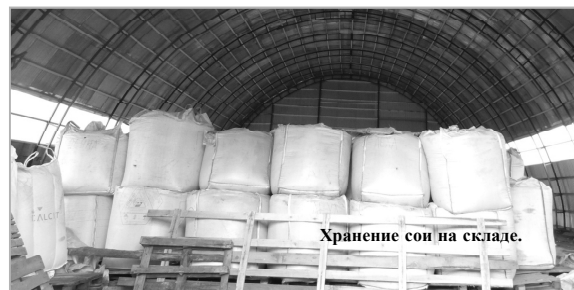
Хранение сои на складе.