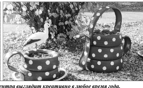
Территория центра выглядит креативно в любое время года.

нологии наставничества в отношении несовершеннолетних, состоящих на различных видах учета.