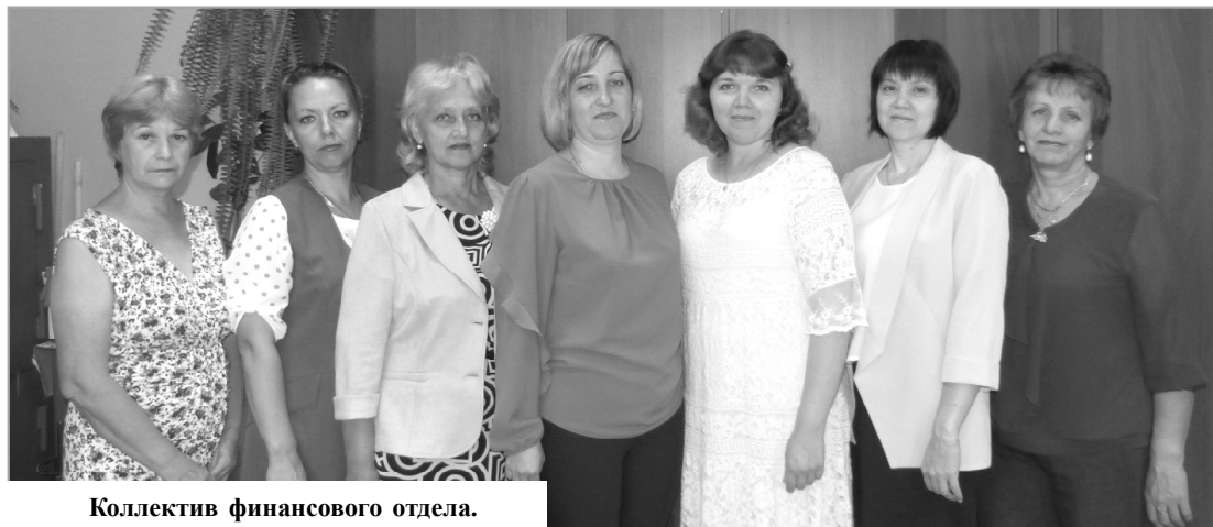
Коллектив финансового отдела.

Всю необходимую информацию о датах приема заявок, проведении аукциона по продаже земельного участка можно получить по адресу: г.Спас-Деменск, ул. Советская, 99, каб.№7, тел. 8 (48455) 2-13-92, с аукционной документацией, формой заявки на участие в аукционе, проектом договора купли-продажи, а также иными находящимися в распоряжении организатора аукциона документами и сведениями претенденты могут ознакомиться по месту приема заявок и на сайте: aspdem@adm.kaluga.ru , www.forgi.gov.ru .