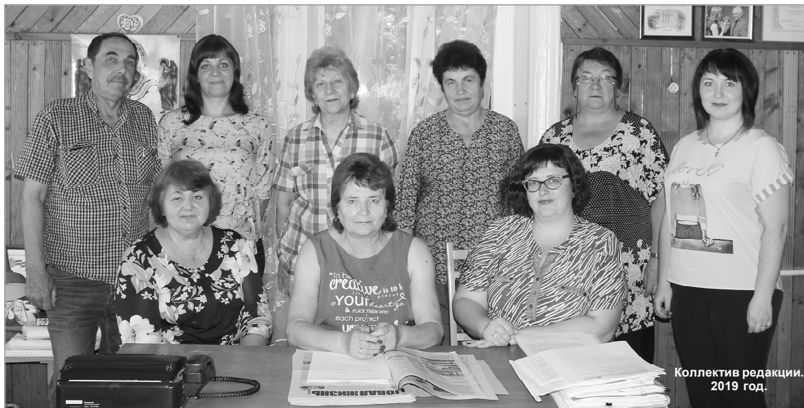
Коллектив редакции. 2019 год.