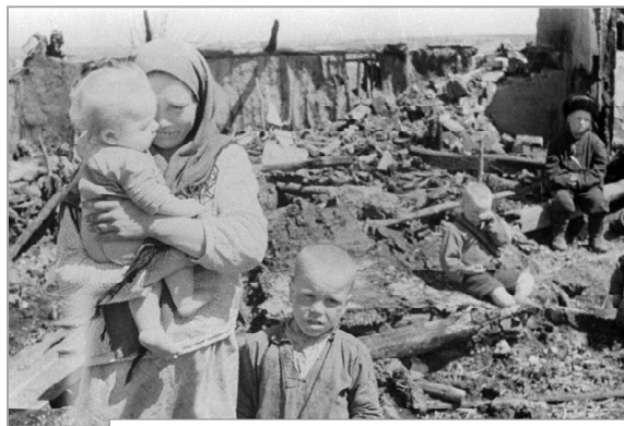
Возвращение на родное пепелище, 1943 год.

Однажды подо льдом увидели что-то похожее на бомбу. Показали взрослым, те сообщили в Спас-Деменск. Приехали