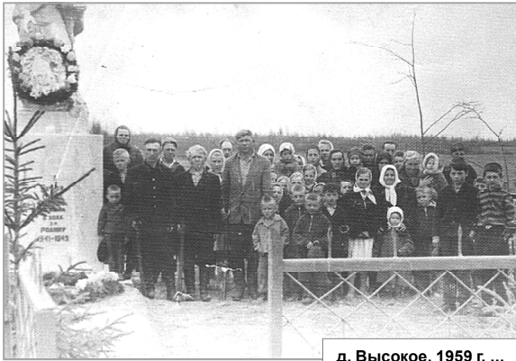
д. Высокое. 1959 г. ...

Убрали картошку вручную, часто в слякоть. Сколько ее