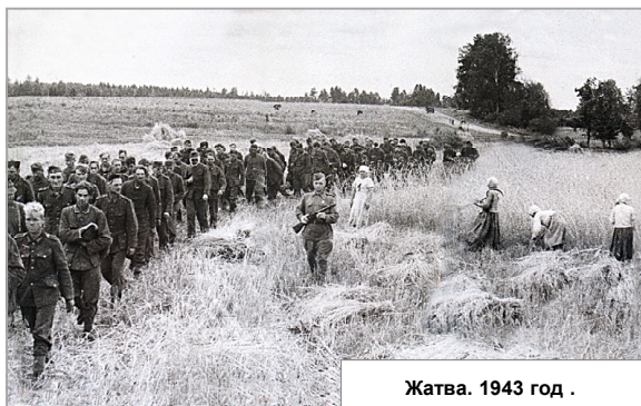
Жатва. 1943 год.