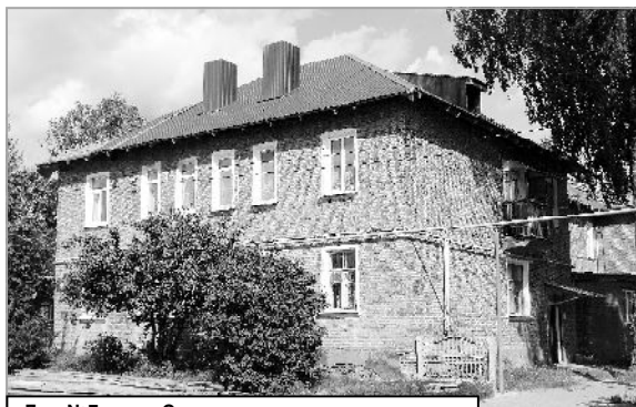
Дом №7 по ул. Советская после капремонта.