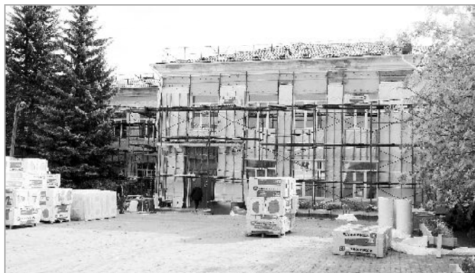
Полным ходом идет ремонт фасада здания средней школы №2. Строители обшивают стены декоративной керамогранитной плиткой.