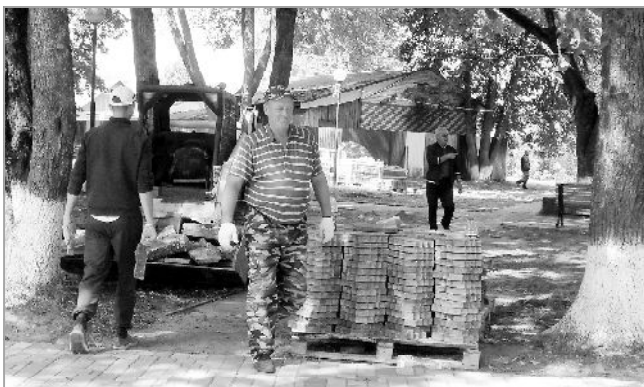
В сквере напротив администрации заканчиваются работы по укладке новой высокопрочной брусчатки.