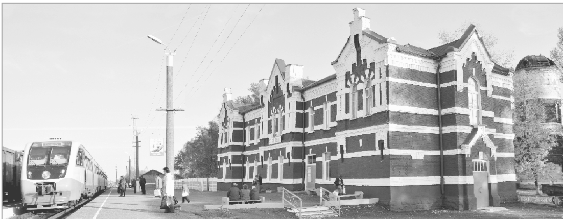
Сегодня через станцию Спас-Деменск проходят пригородные, грузовые и пассажирские поезда дальнего следования.

• В 1950-1960-е годы тяговой единицей Спас-Деменского депо служил паровоз П-36, который работал и с пригородными поездами. Обратное депо ТЧ-48 было закрыто в девяностых годах, часть подвижного состава передана в другие подразделения дороги.