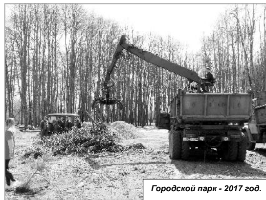
Городской парк - 2017 год.

Оказывается, не все муниципальные образования такие активные, как наше. В восемь из них контракты на освоение дополнительных средств не были заключены в установленные сроки. Эти средства перераспределили в пользу муниципалитетов, имеющих наиболее высокий