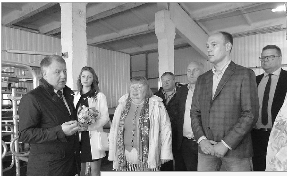
На открытии роботизированной фермы. Июнь 2016 года.