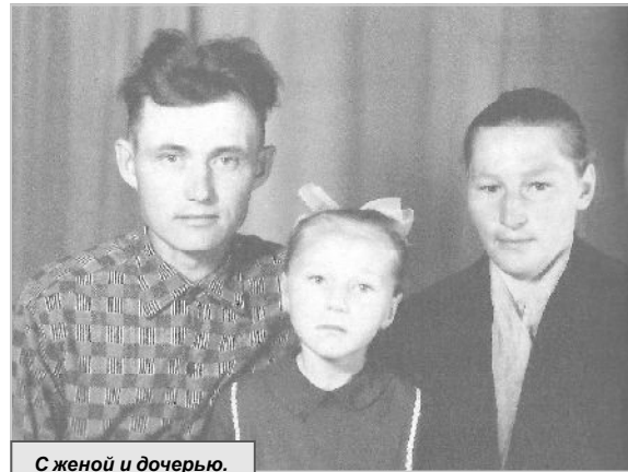
С женой и дочерью.

В марте 1943 года все население погнало на Смоленщину.