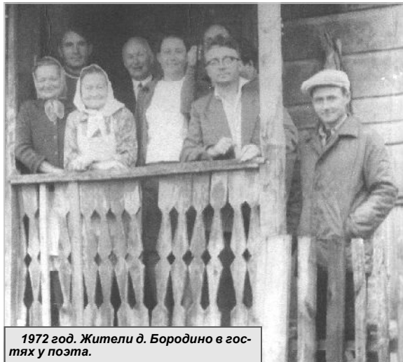
1972 год. Жители д. Бородино в гостях у поэта.

После освобождения Белоруссии внук с бабушкой возвратились в родные места.