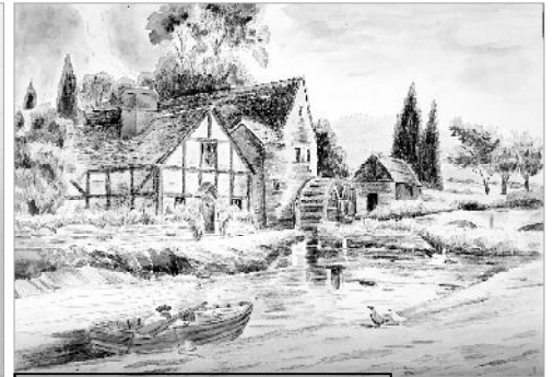
Настя Нечаева, школа №2.