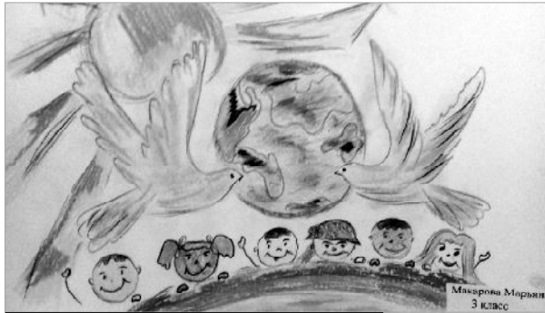
Марьяна Макарова, школа №2.