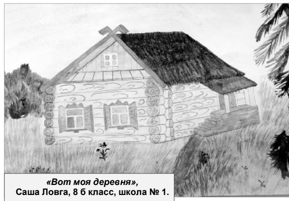
«Вот моя деревня», Саша Ловга, 8 б класс, школа № 1.