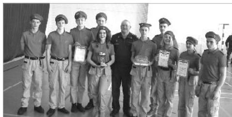
Юнармейский отряд «Беркут» нашей школы занял 1 место в соревнованиях юнармейских отрядов, посвященных 100-летию военных комиссариатов.