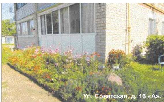
Ул. Советская, д. 16 «А».

Приятно отметить в числе лучших наше градообразующее предприятие кондитерскую фабрику «Хлебный Спас». В вазонах у входа - цветы, во внутреннем дворике - красивая клумба. Большую прилегающую территорию убирают