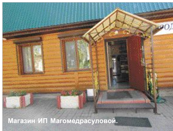
Магазин ИП Магомедрасуловой.

Что касается многоквартирных домов, то лидеры оказались, как всегда, на высоте. Независимо от того, объявлен конкурс на лучший двор или нет, они с ранней весны стали