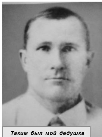
Таким был мой дедушка перед началом войны.

Такая вот печальная непростая история о простом крестьянском парне,