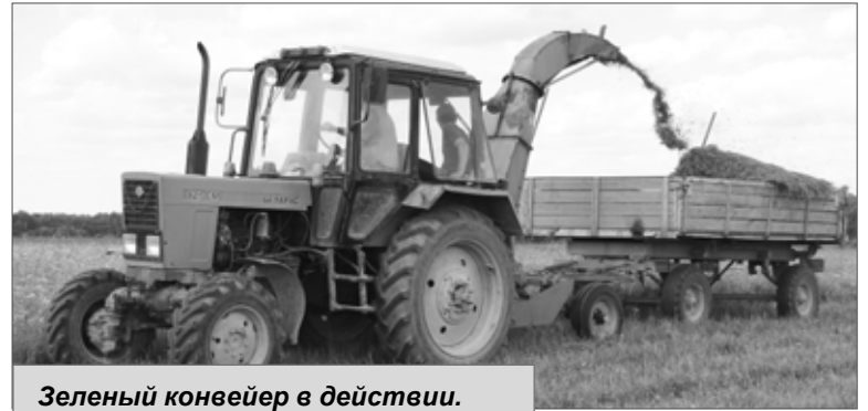
Зеленый конвейер в действии.

P.S. На 27 июня КФХ Мартыновых скосило 180 га, заготовило сенажа - 247 тонн, сена - 30 тонн.