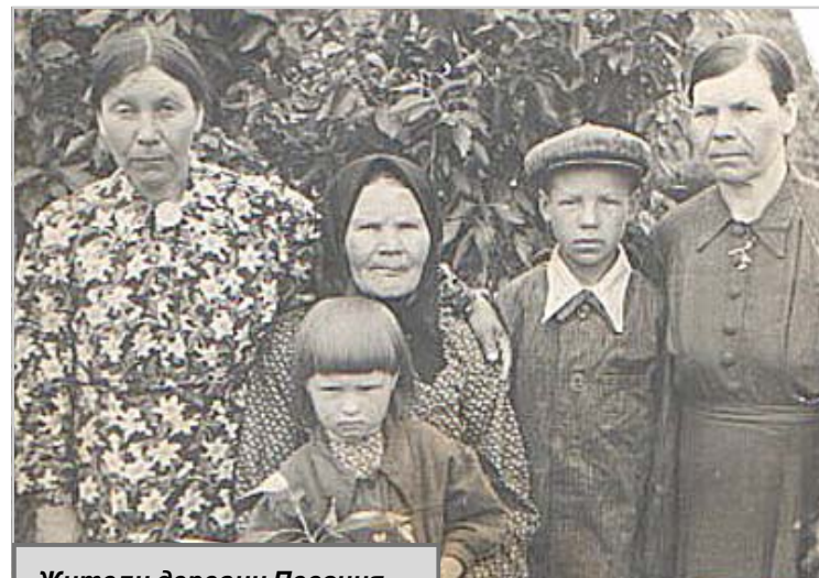
Жители деревни Песочня.

Лариса НИКИТИНА.