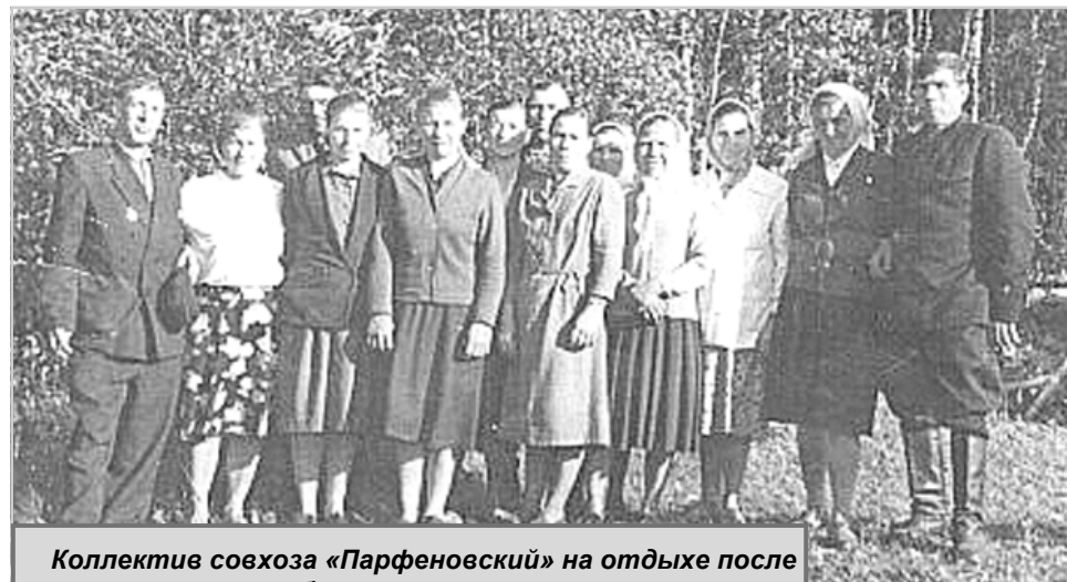
Коллектив совхоза «Парфеновский» на отдыхе после весенне-полевых работ.

После этого пения хозяйка угощала и давала мелких монет. Днем в центре деревни собирались все – и взрослые, и дети. Обычно мужчины играли в игру, которая называлась расшибаловка. Благо, мелкой монеты у всех было достаточно. Игроки выставляли на кону стопку, по количеству участников, одинаковых монет решкой вверх. С расстояния в несколько метров каждый ки-