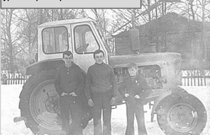
Ученики Чипляевской школы на уроке «Трактора».

Люди в деревне были верующими, хотя и называли себя атеистами. В семьях Бога чтити, соблюдали пост и праздновали церковные праздники. На Пасху дети в возрасте до 12 лет ходили в так называемые «волочевнички». Утром в воскресенье вставали аж в четыре утра, стучались в окошки соседей и хозяйке кричали: «Тетя! Ти петь?». Если она отвечала «пой», начинали протяжно, как бы нараспев, читать стих: