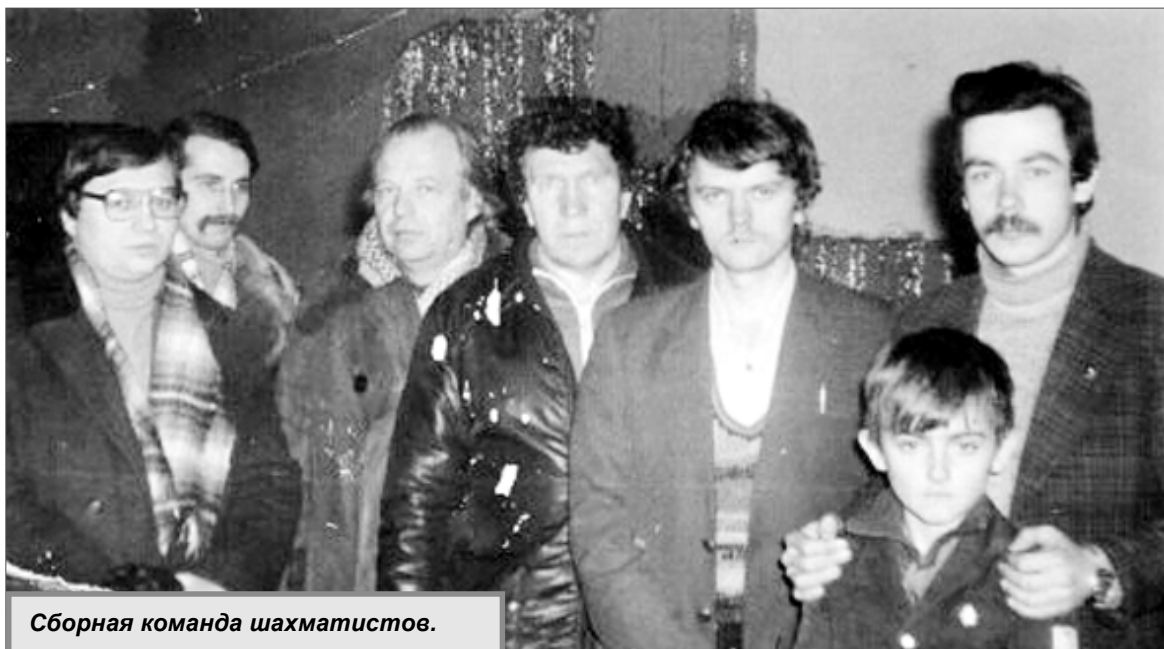
Сборная команда шахматистов.