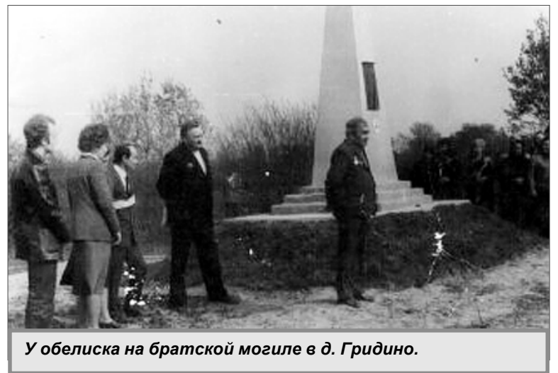
У обелиска на братской могиле в д. Гридино.

В июле 1955 года в Гридино провели радио. В дом, где оборо-