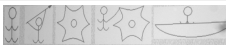
Человек, копье, шкура, лодка,

самым дорого христианству на восток. Братья канонизированы как святые и почитаются на Востоке и на Западе. В Европе день Кирилла и Мефодия отмечается 11 мая. 30 января 1991 года состоялось официальное утверждение празднования дня Кирилла и Мефодия в России. Датой было выбрано