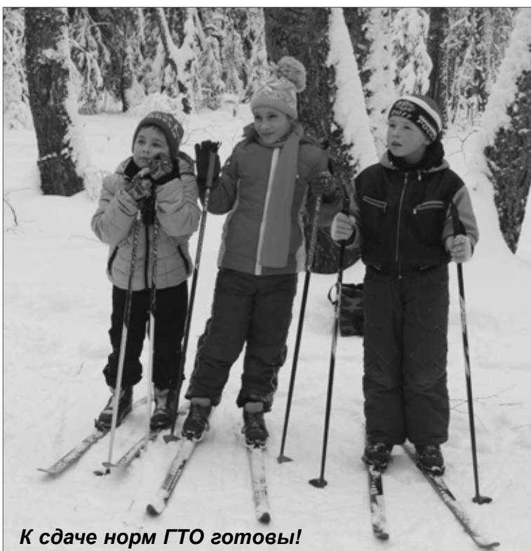
К сдаче норм ГТО готовы!