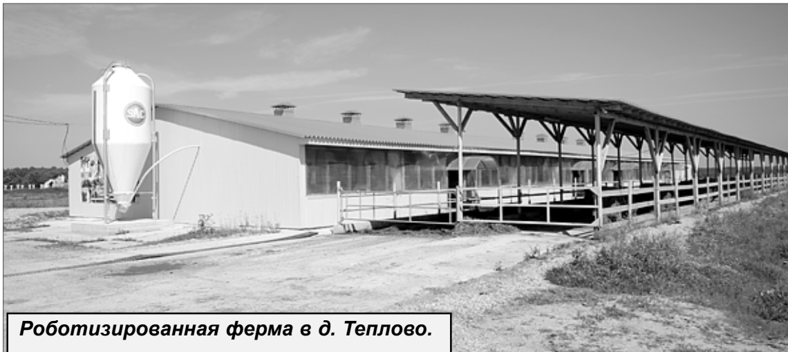
Роботизированная ферма в д. Теплово.