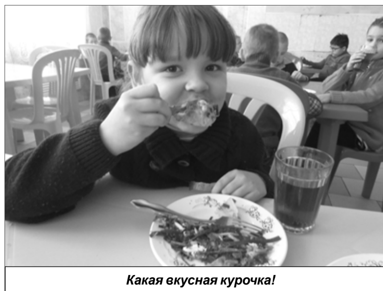
Какая вкусная курочка!

В школьных столовых проведены ремонты, по мере необходимости приобретают новое оборудование. Недавно купили