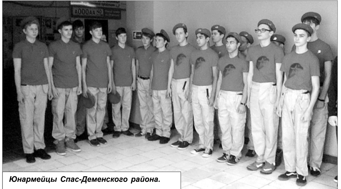
Юнармейцы Спас-Деменского района.