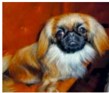
Пекинесы Мишель и шалун Венька.