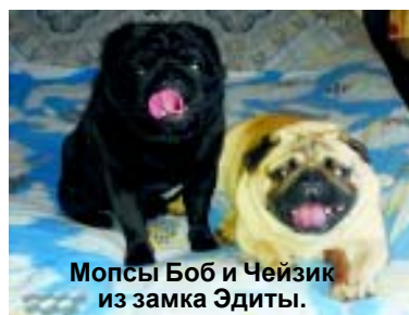
Мопсы Боб и Чейзик из замка Эдиты.