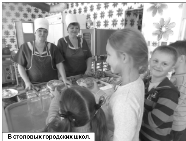
В столовых городских школ.