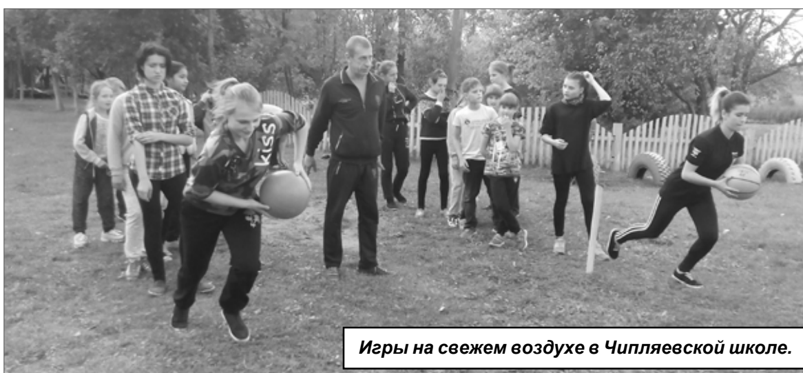
Игры на свежем воздухе в Чипляевской школе.