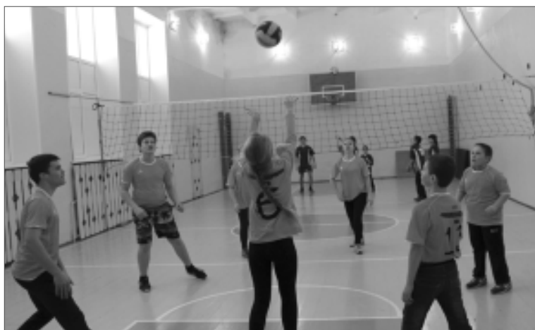
Занятия в спортзале Новоалександровской школы.

В Новоалександровской школе помимо спортивных мероприятий провели анкетирование на тему: «Умею ли я беречь свое здоровье». Выпустили общешкольную газету, посвященную Неделе здоровья. Провели вы-