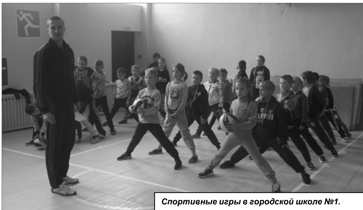
Спортивные игры в городской школе №1.